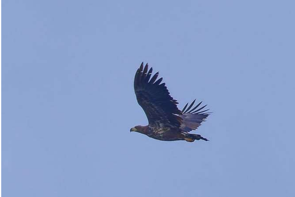
Seeadler (Foto: ornitho.de – Bernd Kaiser)

15.12.2024 1 Ind. am Starnberger See (Bernd Kaiser)