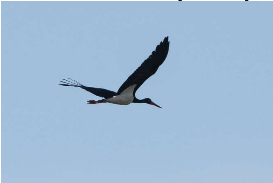
Schwarzstorch (Foto: ornitho.de – Antje Geigenberger)

28.04.2024 1 Ind. bei Rothenfeld Richtung Kerschlach fliegend (Burkhard Quinger)