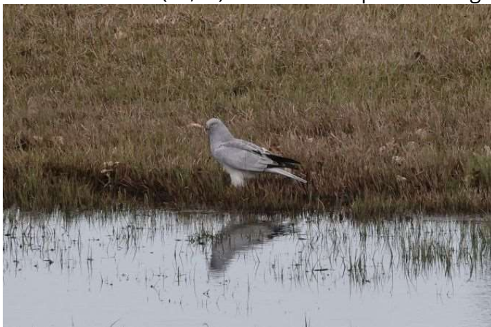
Männliche Kornweihe

15.03.2024 54 (24,30) Ind. bei Schlafplatzzählung im Herrschinger Moos (UZW, UB)