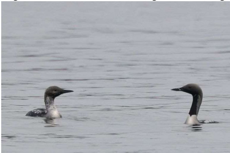
Prachttaucher (rechts im Prachtkleid)

Insgesamt 71 (1-22 Ind.) Beobachtungen am Starnberger See (viele Beobachter).