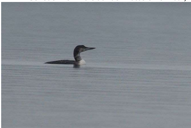
Eistaucher adult

der adulte Vogel hielt sich vermutlich bis 11.02. am Gombether See in Hessen auf, wurde dort zuletzt von Bastian Meise und Natascha Schütze gemeldet (individuelle Gefiedermerkmale auf den Fotos erkennbar)