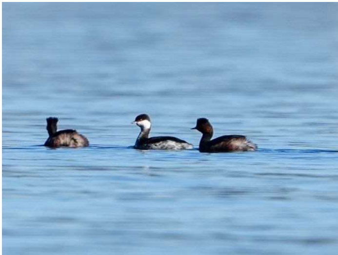
Ohrentaucher mit 2 Schwarzhalstauchern