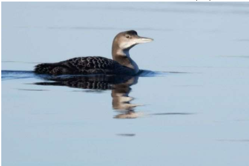
Eistaucher (2. KJ)

Insgesamt 16 Beobachtungen (jew. 1 Ind.) in der Zeit vom 5. bis 31. Januar am Starnberger See. Leider sind die meisten Beobachtungen ohne Altersangabe, sodass darüber nicht festgestellt werden kann, ob es unterschiedliche Individuen waren. Am 30. Januar waren wahrscheinlich 2 Ind. am See zu beobachten, da sie relativ kurz hintereinander an zwei unterschiedlichen Stellen beobachtet wurden (OF).