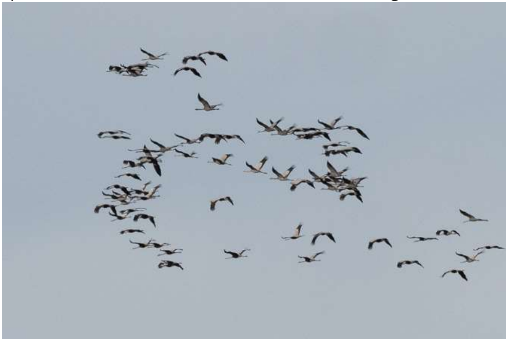
Ziehende Kraniche

Später im Monat immer wieder vereinzelt Beobachtungen.