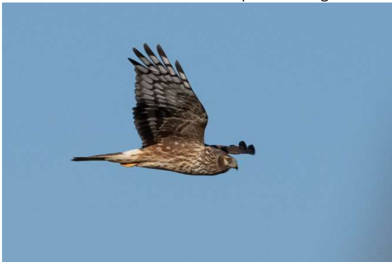
Weibchenfarbige Kornweihe