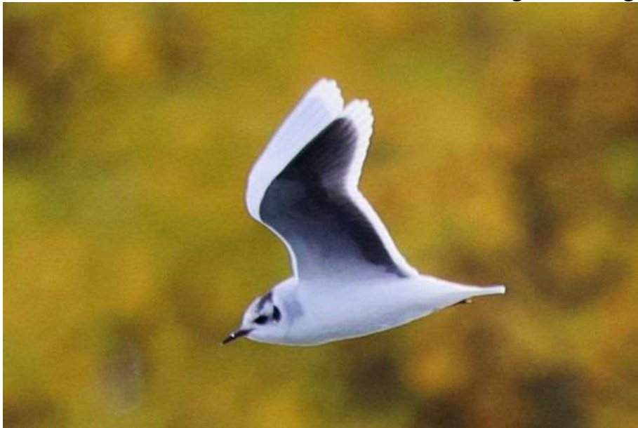
Adulte Zwergmöwe

Bei der WVZ am Wörthsee wurde ebenfalls eine Zwergmöwe festgestellt (RiR)