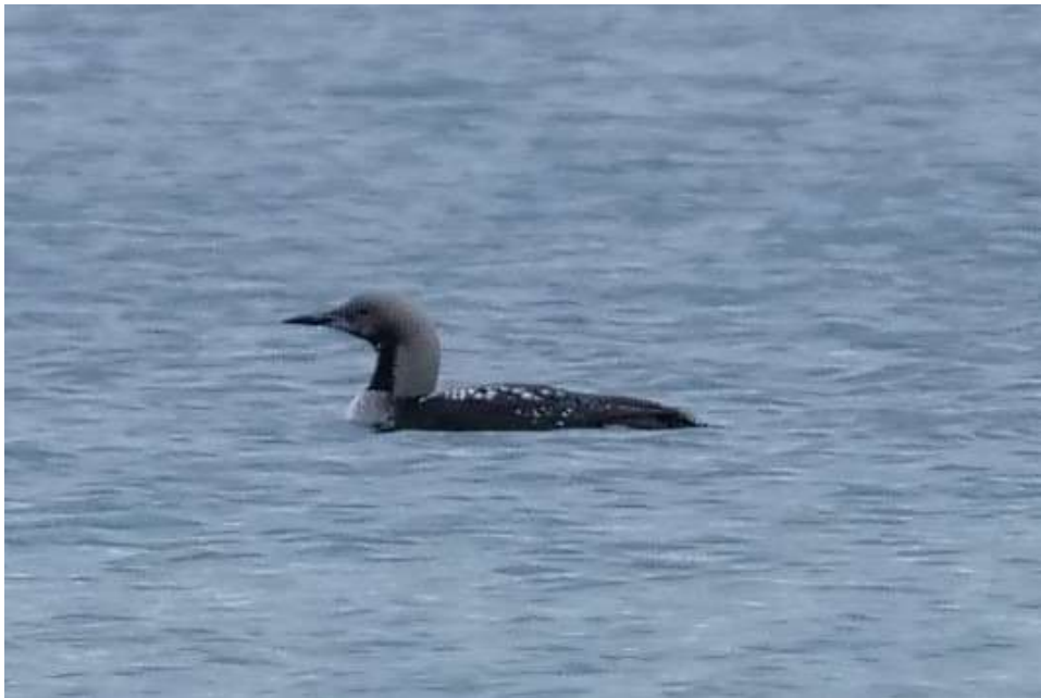
Prachttaucher im PK

Seit Mitte Oktober insgesamt 26 Beobachtungen (1 – 38 Ind.) im Süden des Starnberger Sees (mehrere Beobachter). Teilweise waren die Prachttaucher noch im Prachtkleid.