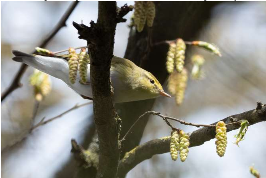
Waldlaubsänger