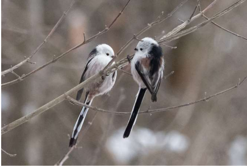
Schwanzmeise, ssp. caudatus

29.01.2023 2 Ind. in einem Trupp mit anderen Schwanzmeisen (AGei)