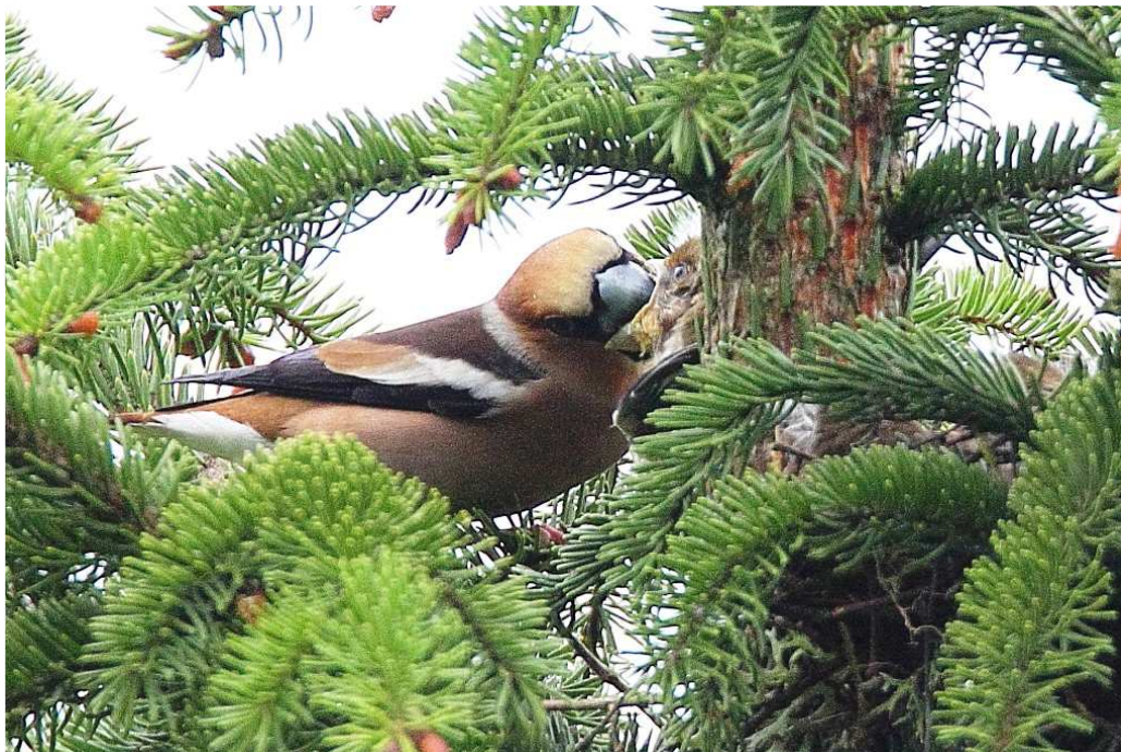
Kernbeißer