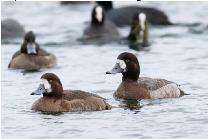
weibliche Bergenten

Während des gesamten Monats am Starnberger See (meist im Süden bis Höhe Karpfenwinkel) zu beobachten. Insgesamt 11 Beobachtungen (1-4 Ind.) (viele Beobachter)