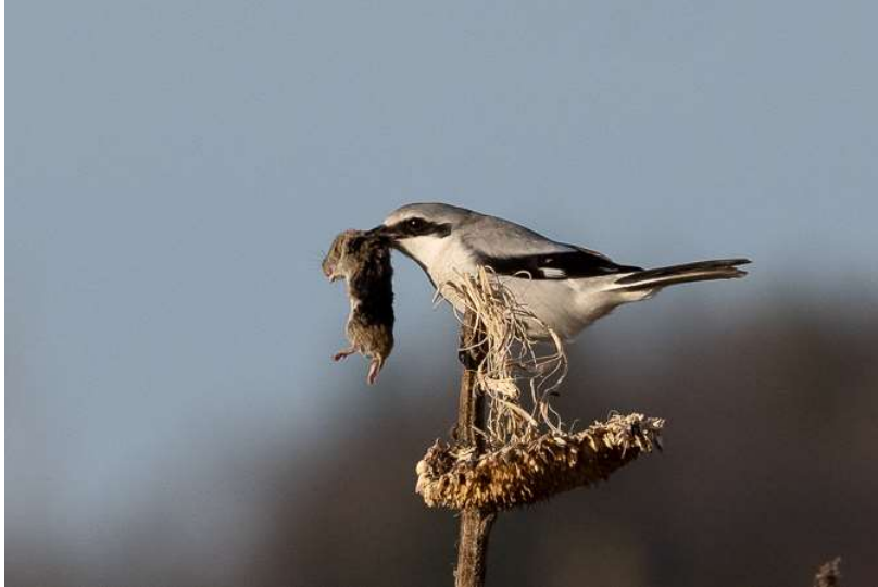
Raubwürger mit Beute