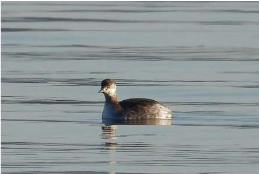
Rothalstaucher (Foto: ornitho.de – Bernd Kaiser)

Während des ganzen Monats regelmäßig vor allem am Ostufer und im Süden des Starnberger Sees zu beobachten. Insgesamt 33 Beobachtungen (1-2 Ind.) (viele Beobachter).