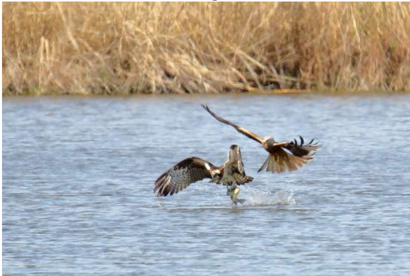
Fischadler mit Beute, verfolgt von Rotmilan

29.04.2022 1 Ind. am Maisinger See (CIH, Julia Höll, UB)