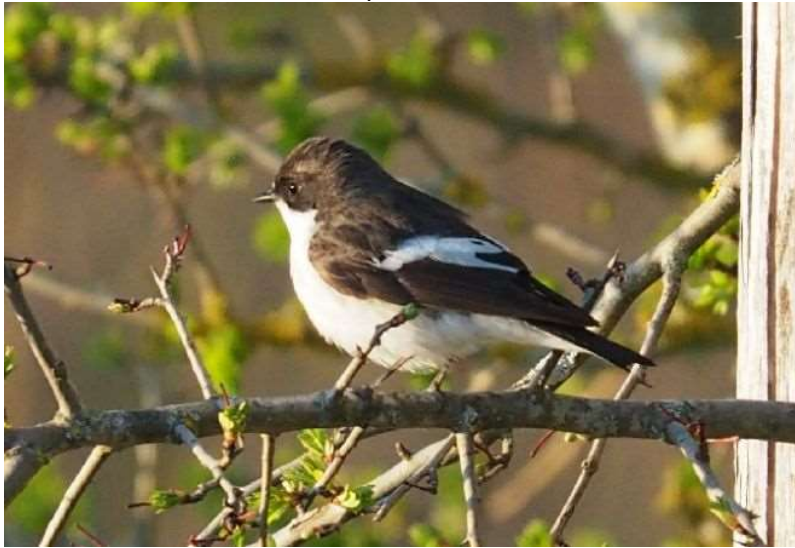
Trauerschnäpper (Foto: ornitho.de – Richard Roberts)

03.04.2021 1 Ind. im Ampermoos (Steffen Drobnik)