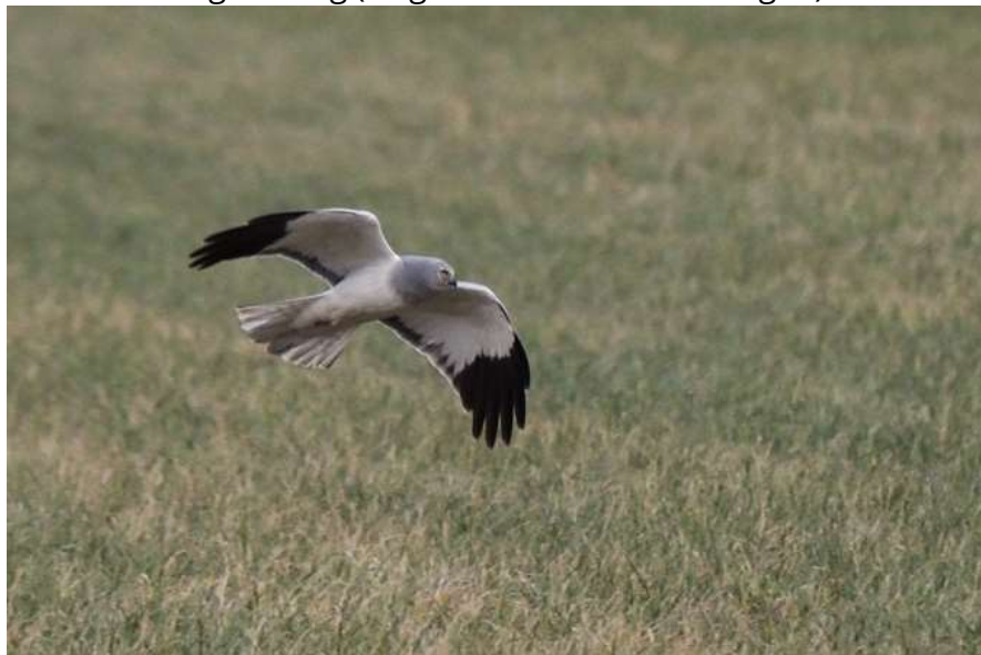
Männliche Kornweihe

Ansonsten regelmäßig (insgesamt 20 Beobachtungen) in der Feldflur zu beobachten.