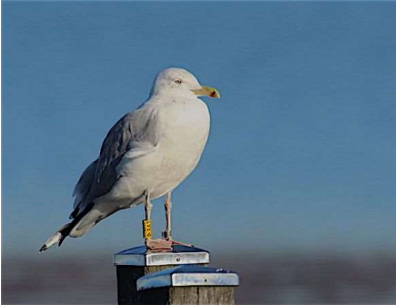
Steppenmöwe (vermutlich hybrid)

Die Möwe (gelb P:8A7) ist vermutlich ein Hybrid (Steppenmöwe x Mittelmeermöwe).