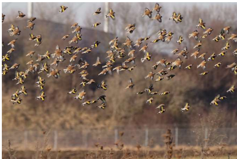
Schwarm Bluthänfling/Stieglitz