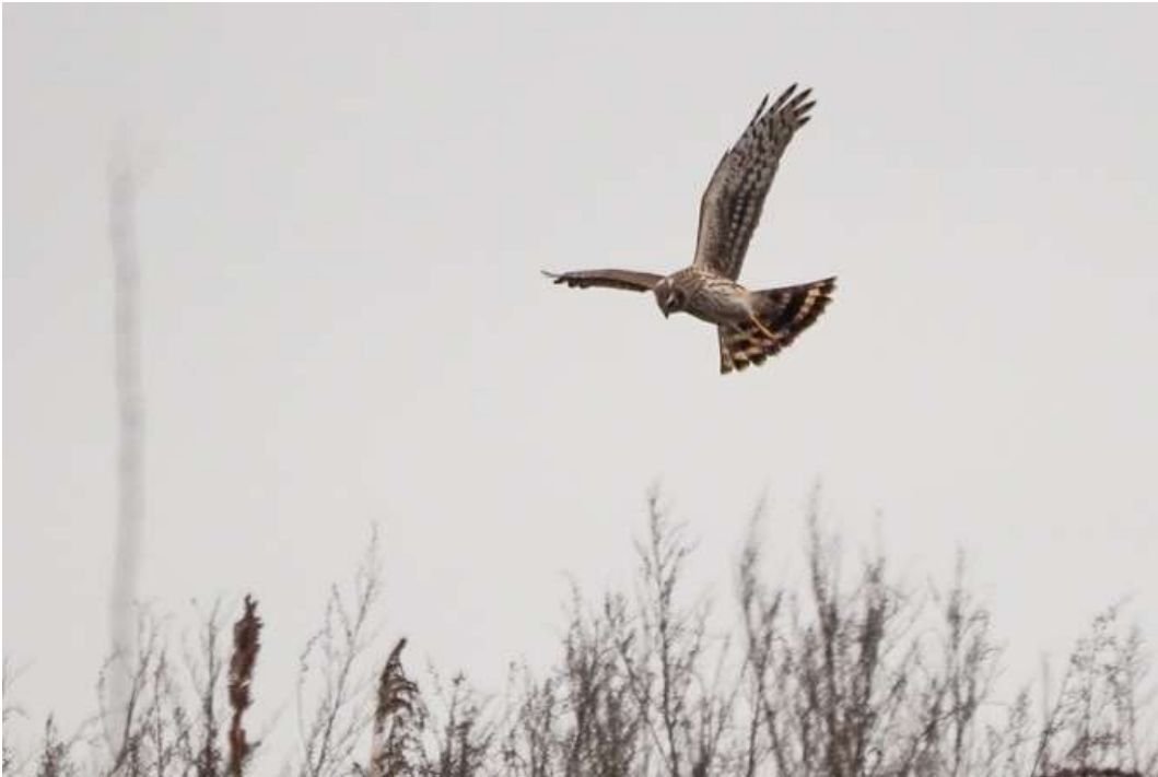
Weibchenfarbige Kornweihe