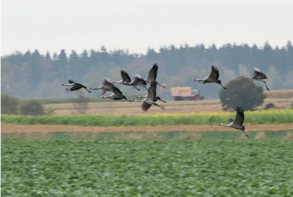
Kraniche bei Buchendorf