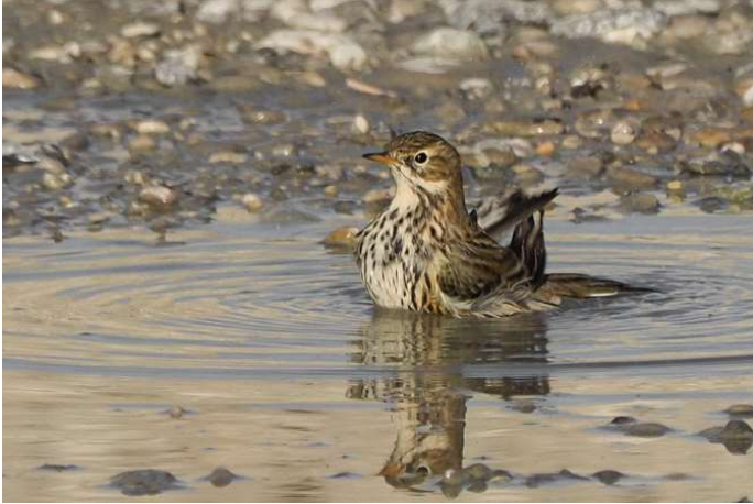
Wiesenpieper (Foto: ornitho.de – Antje Geigenberger)

27.10.2019 ca. 50 Ind. bei Buchendorf (AGei)