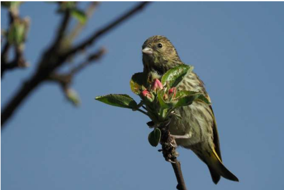
diesjähriger Erlenzeisig

Mehr als 30 Beobachtungen (1-5 Ind.) aus allen Gegenden des Landkreises, darunter auch mehrere Brutnachweise.