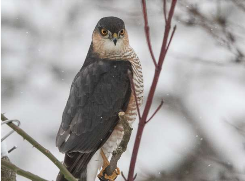
Sperber auf Ansitz nahe der Futterstelle