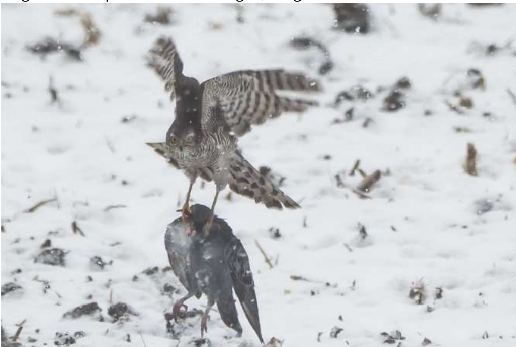
Sperber erbeutet Ringeltaube

Insgesamt 30 Sperberbeobachtungen, einige davon mit sehr schönen Fotos