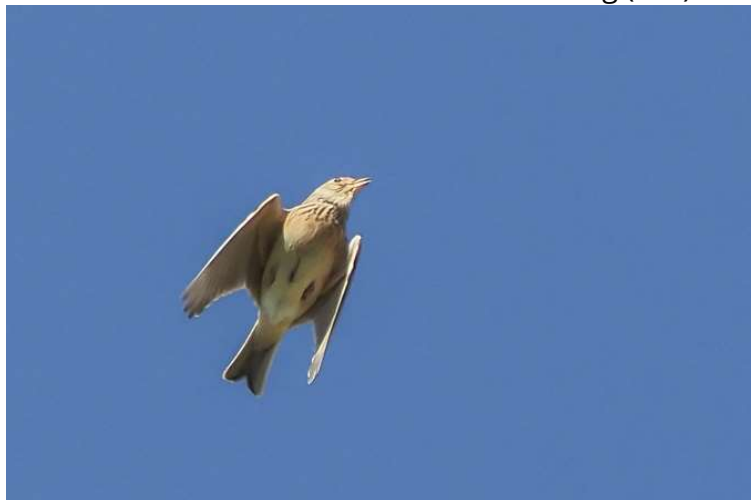
ziehende Feldlerche