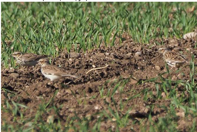
Rastende Heidelerchen

Insgesamt 13 (1-5 Ind.) Beobachtungen vor allem vom Zug am Höhenberg, aber auch rastend in der Feldflur (AGei, PBr, JB)