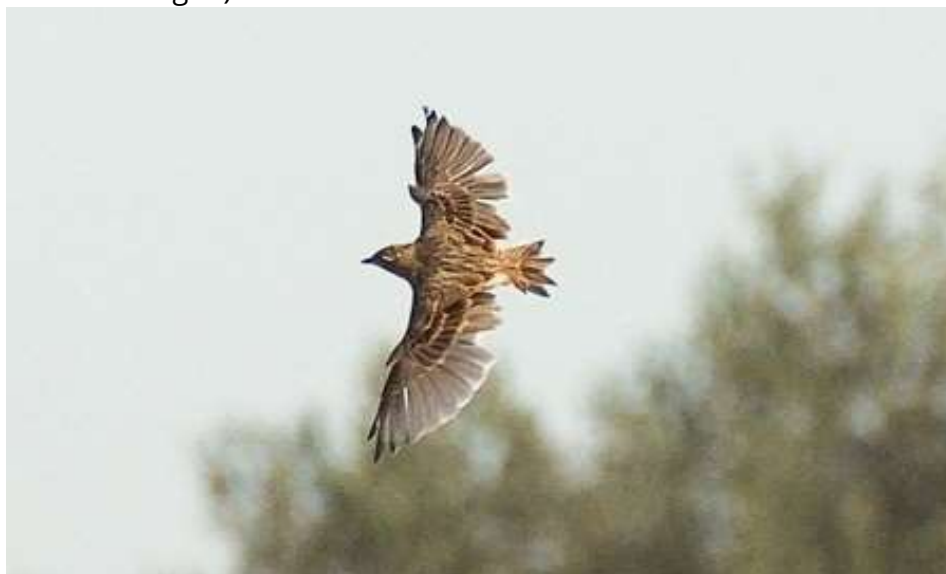
Mausernde Feldlerche

Insgesamt 11 Beobachtungen(1-26 Ind.) auf den Feldern oder ziehend am Höhenberg (diverse Beobachtungen)