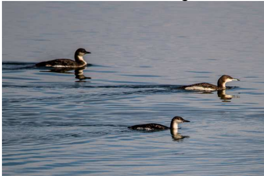
Prachtaucher am Starnberger See

Prachtaucher: Regelmäßig am Starnberger See zu beobachten. 33 Individuen bei der Wasservogelzählung Mitte des Monats. Ansonsten fast täglich Meldungen über Prachtaucherbeobachtungen von vielen Beobachtern.