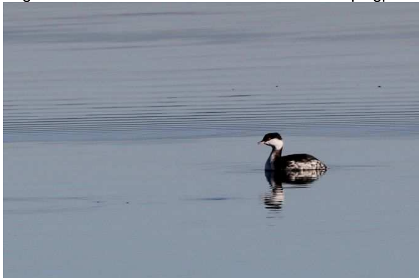
Ohrentaucher (Foto: ornitho.de - Peter Brützel)

Tagesmaximum: 10.12.2016 4 Ind. am Campingplatz in Seeshaupt (MaS)