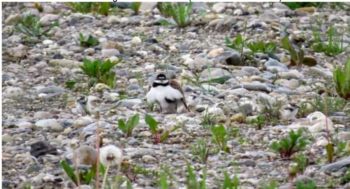
Flussregenpfeifer mit pulli

Brutverdacht aus der Kiesgrube Oberbrunn (mehrere Beobachter).