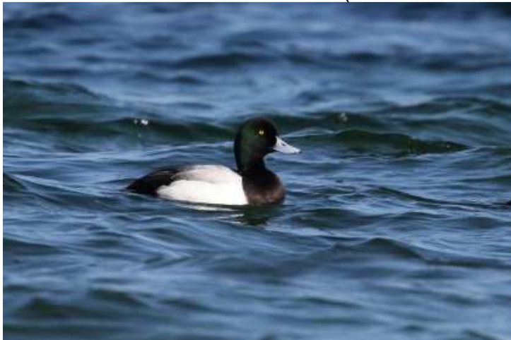
Bergente(Foto: ornitho.de - Wolfgang Einsiedler)

30.03.2016 4 Ind. bei Seeseiten (Winfried Scharlau)