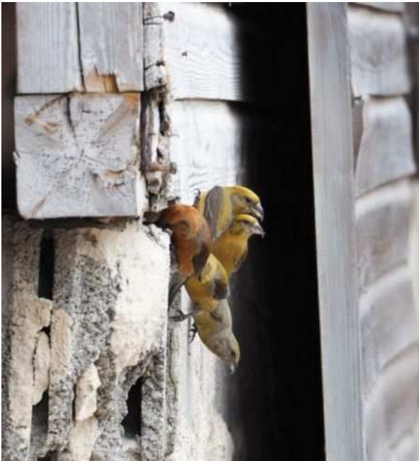
Fichtenkreuzschnäbel an Garagenmauer Nahrung suchend

Bemerkung des Beobachters: Paar mit diesjährigen immaturren Ex., u.a. am Teichrand Nahrung suchend.