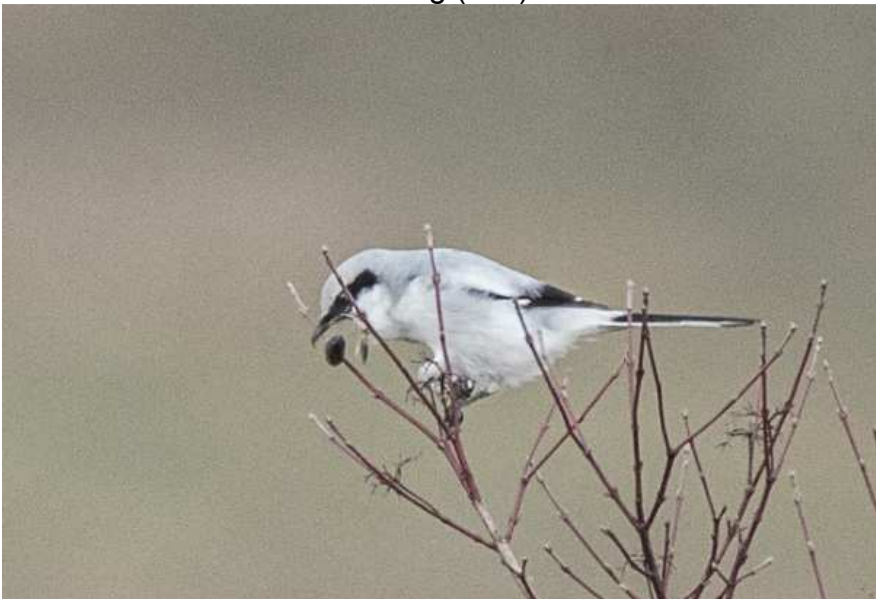
Raubwürger beim Auswürgen eines Speiballens