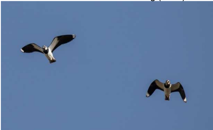
Ankunft der Kiebitze

08.02.2016 1 Ind. bei Aufkirchen Halsbach Nord (WoS) 22.02.2016 1 Ind. im Ampermoos (PBr, PW_i) 22.02.2016 ca.10 Ind. bei Aschering (UZW)