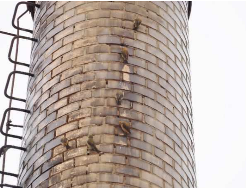
Fichtenkreuzschnäbel fressen an Kamin aus Mauerfugen