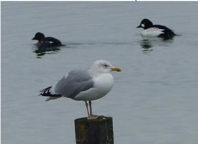
Silbermöwe (Foto: ornitho.de - Wolfgang Podszun)

24.01.2016 1 Ind. am Undosa (Tobias von Lukowicz)