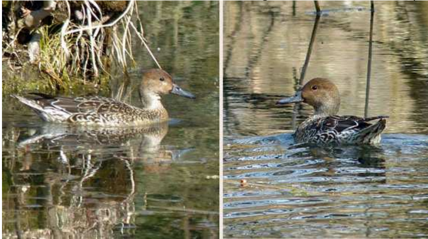
Spießente (Foto: ornitho.de - Karo Wenzel)

18.03.2015 1 Weibchen am Starnberger See bei Bernried (Karo Wenzel)