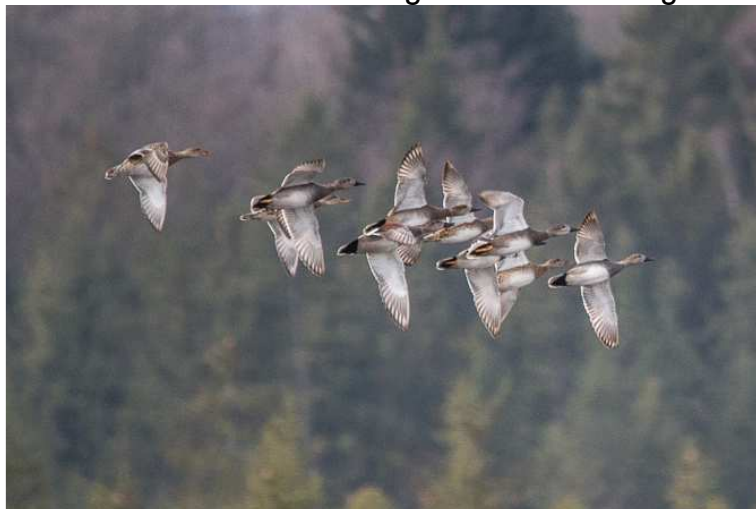
Schnatterenten am Maisinger See

15.01.2015 10 Ind. über zugefrorenen Maisinger See fliegend (UZW)