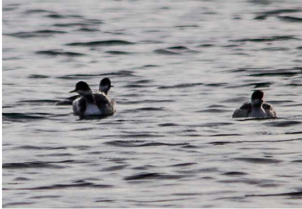
Schwarzhalstaucher am Starnberger See