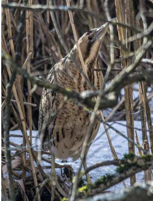
Rohrdommel am Maisinger See