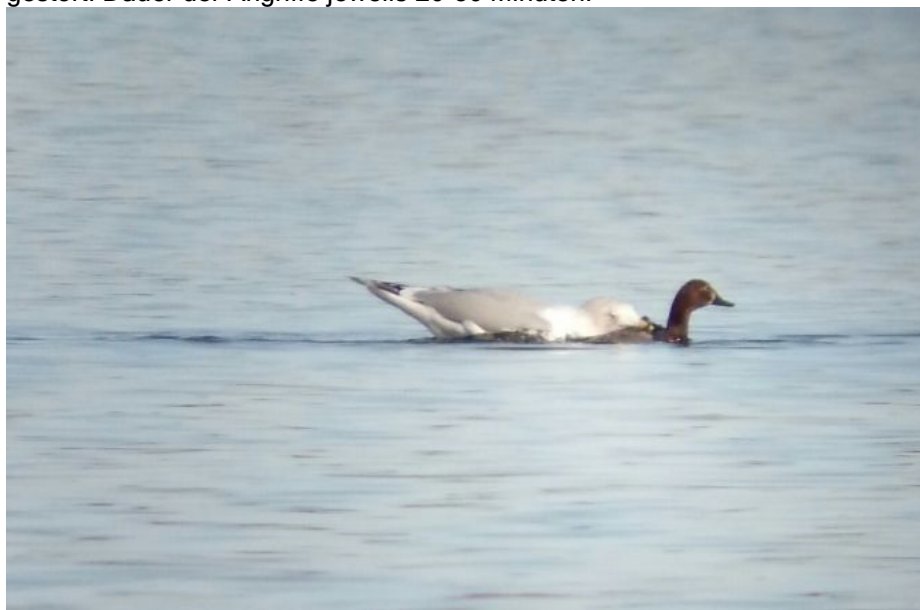
Silbermöwe attackiert Tafelente

Bemerkung des Beobachters: Silbermöwe macht aktiv Jagd auf Enten. Zunächst schwere Biss- und Tunk-Attacken auf weibliche Tafelente (siehe beigefügte Fotos). Nach Ablassen weiterer (erfolgreicher) Angriff auf wahrscheinl. weibliche Schellente. Beim Verzehr der Beute auf dem Wasser kurz von Mittelmeermöwe gestört. Dauer der Angriffe jeweils 20-30 Minuten.