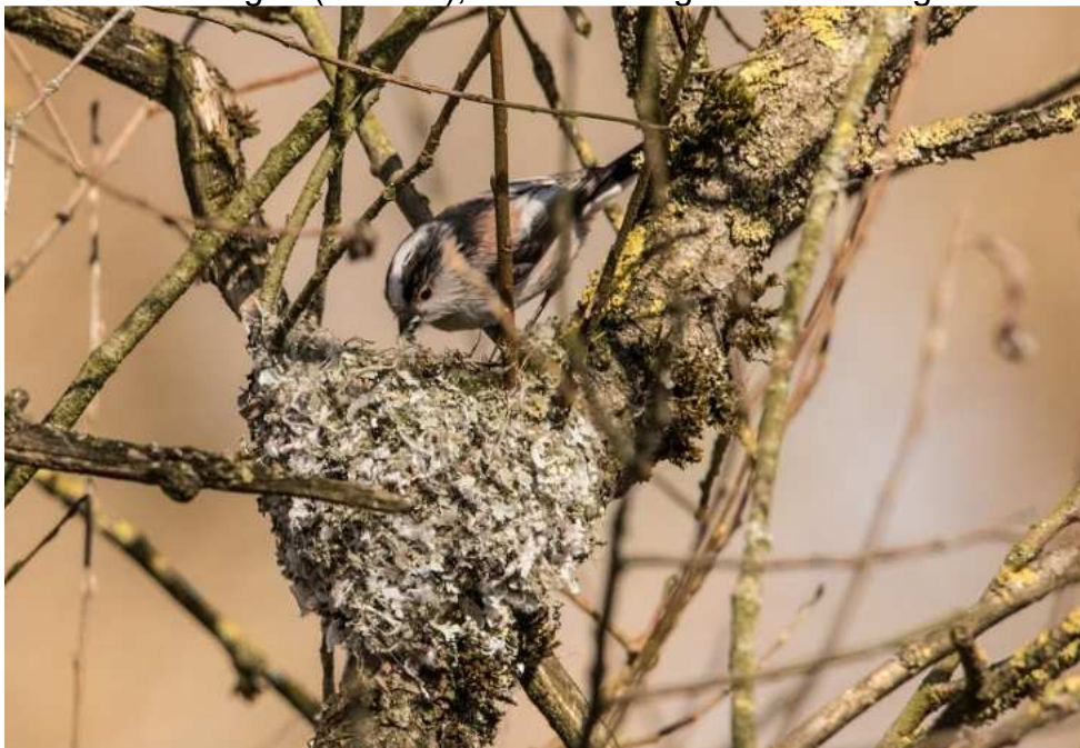
Schwanzmeise beim Nestbau

42 Beobachtungen (1-4 Ind.), darunter einige Beobachtungen beim Nestbau.