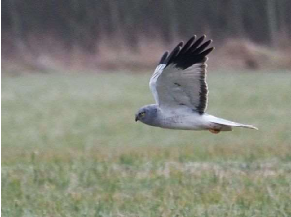
Männliche Kornweihe