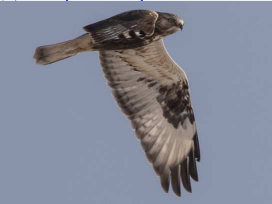
Raufußbussard 2.KJ